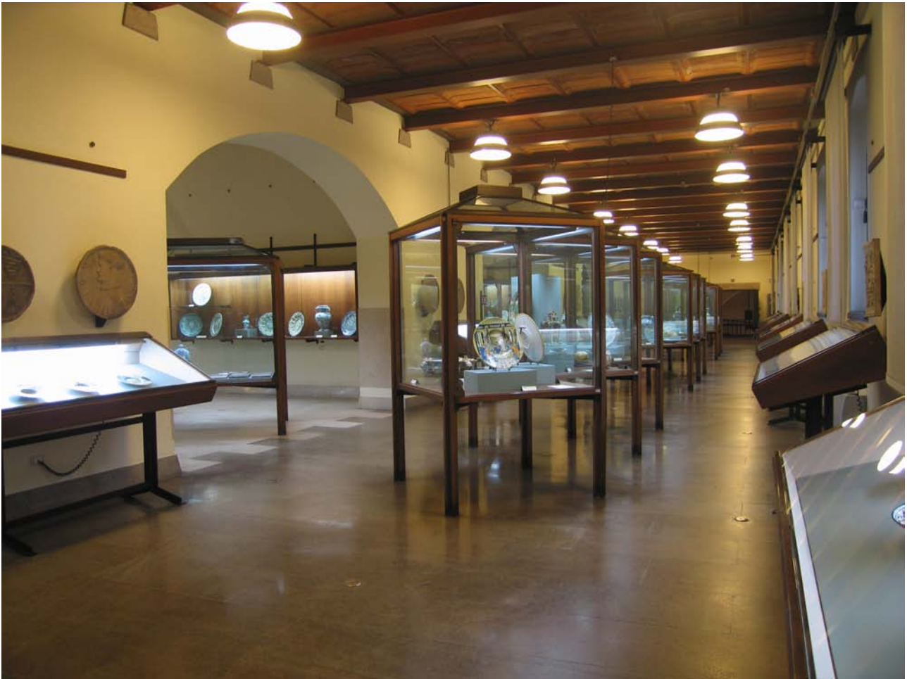
fig. 5 – Sala XXX