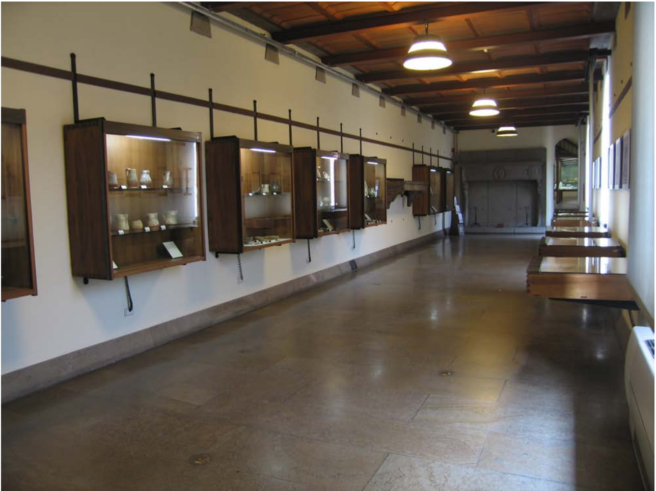
fig. 3 – Sala XXIX