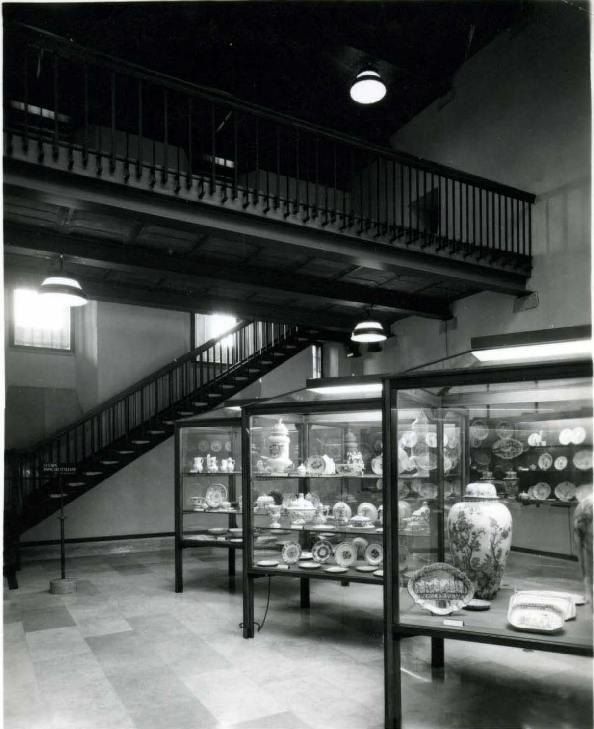
fig. 2 – La sala XXX, box 5, in una fotografia degli anni sessanta