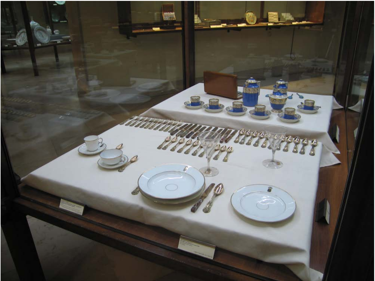
fig. 6 – Sala XXX, box 1, tavole imbandite