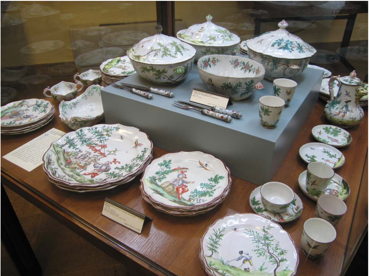
fig. 7 – Sala XXX, servizio Clerici