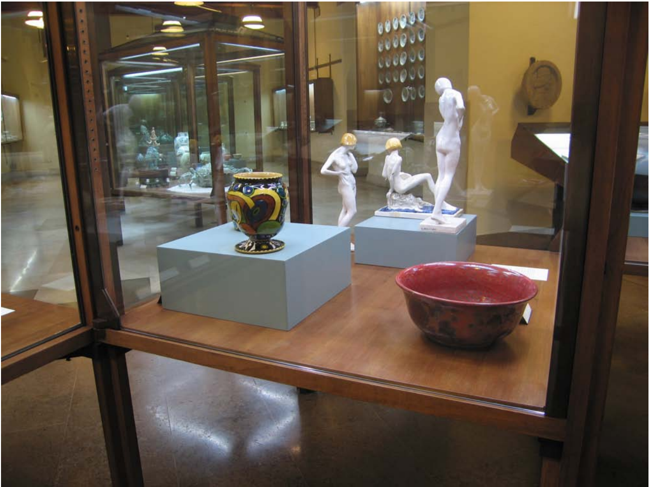
fig. 9 – Sala XXX, maioliche del Novecento