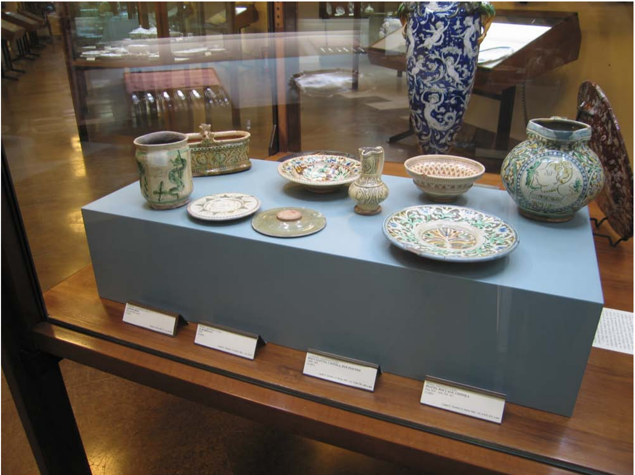
fig. 8 – Sala XXX, produzione Loretz