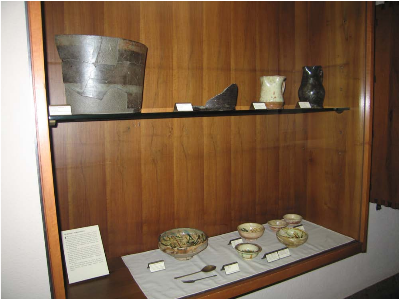
fig. 4 – Sala XXIX, vetrina con gli oggetti da cucina e da mensa